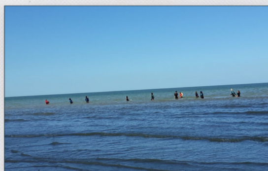
Familles de La Vie Active (Béthune) Ville du Touquet