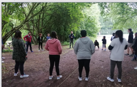
Familles du FIAC (Berck) Parc Départemental d'Olhain