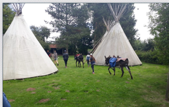
Familles du CCAS de Liévin Gîte à Petits pas de Ruisseauville