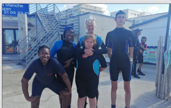
Familles de La Vie Active (Béthune) Ville du Touquet